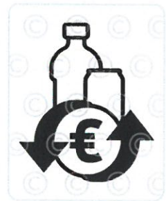
Das österreichische Pfandlogo